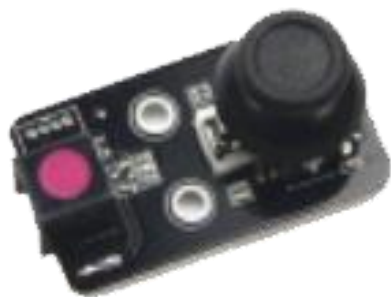
图 2 摇杆控制模块