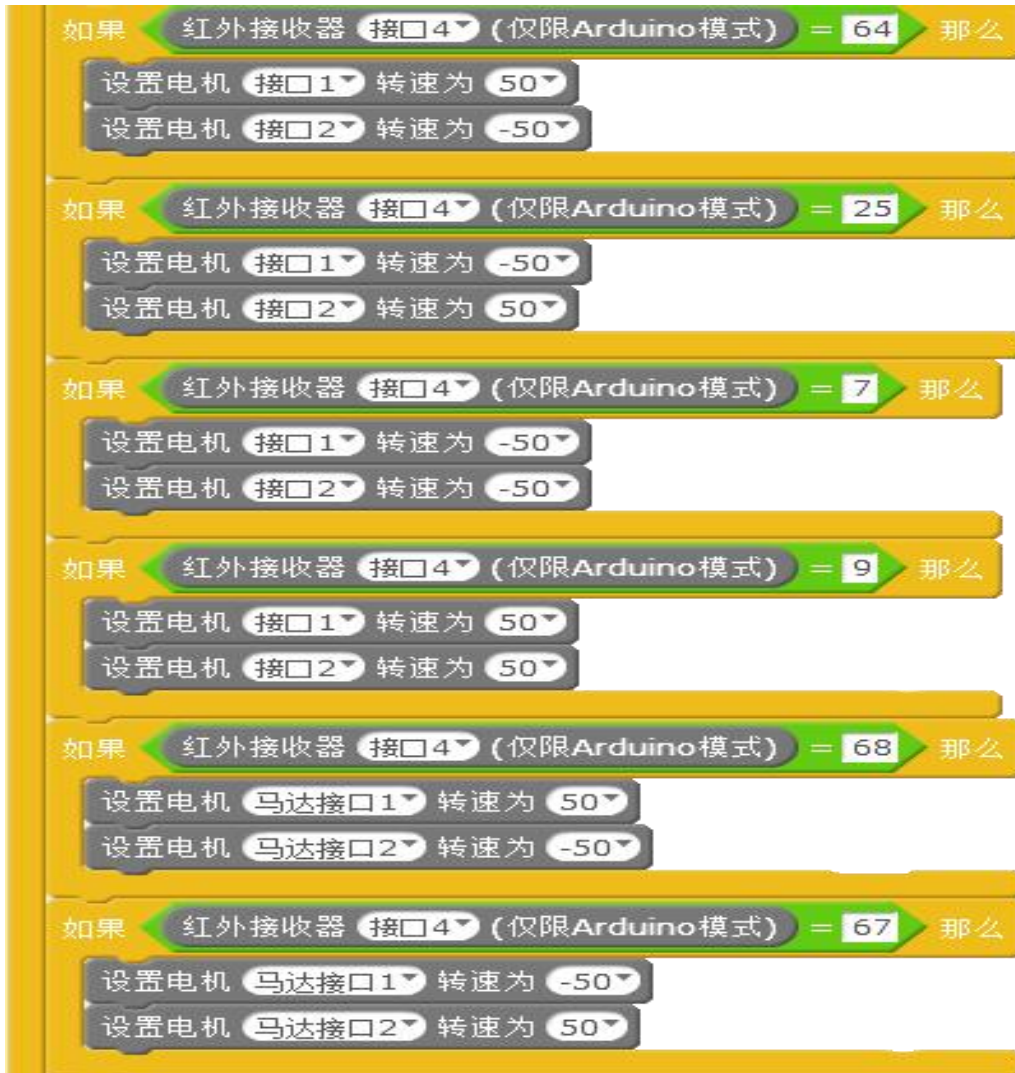
图 4 红外控制代码