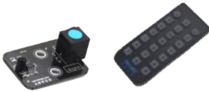
图 1 红外遥控模块